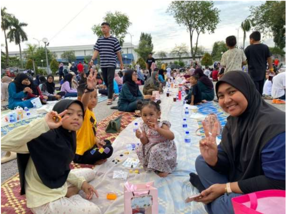
Pengunjung turut hadir memeriahkan program Iftar Ala Madinah @Karangkraf bersama anak-anak.

Jelasnya, jika program itu tidak diadakan, mereka mungkin akan membelanjakan wang sebanyak RM15 hingga RM20 sehari untuk membeli juadah berbuka.