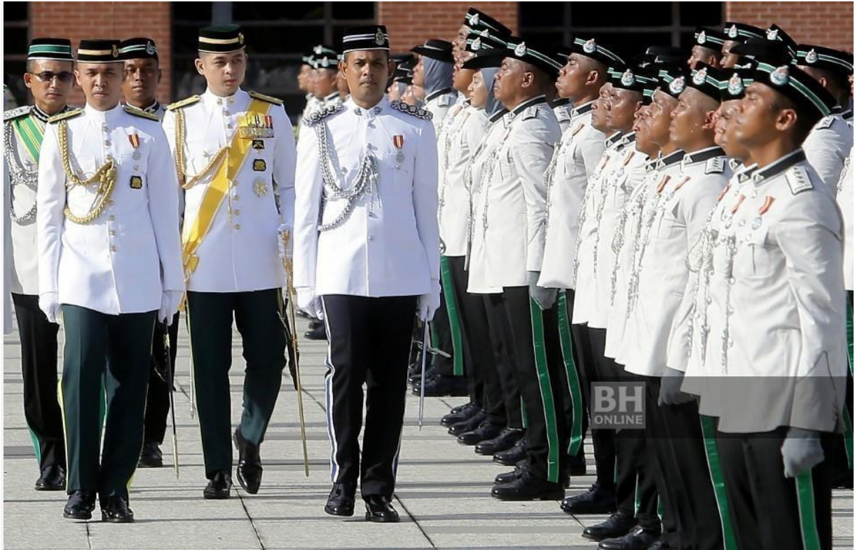
Pemangku Raja Pahang, Tengku Hassanal Ibrahim Alam Shah Al-Sultan Abdullah Ri'ayatuddin Al-Mustafa Billah Shah (tengah).

KUANTAN: Pemangku Raja Pahang, Tengku Mahkota Tengku Hassanal Ibrahim Alam Shah Al-Sultan Abdullah Ri'ayatuddin Al Mustafa Billah Shah memberi perkenan pembentukan kerajaan negeri daripada Barisan Nasional (BN) dan Pakatan Harapan (PH).