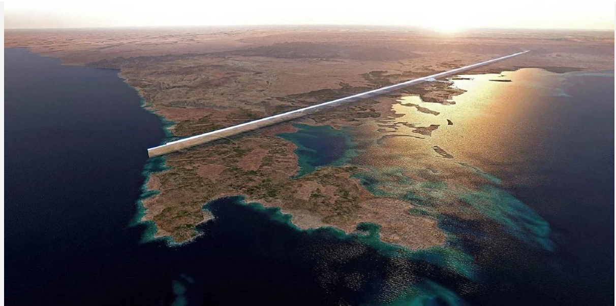
LAKARAN artis projek The Line.

Riyadh: Projek Neom Arab Saudi bernilai AS$500 bilion (RM2.24 trilion) mencatat rekod tersendiri apabila akan menjadi 'rumah' kepada pencakar langit sepanjang 120 kilometer dikenali sebagai Mirror Line.