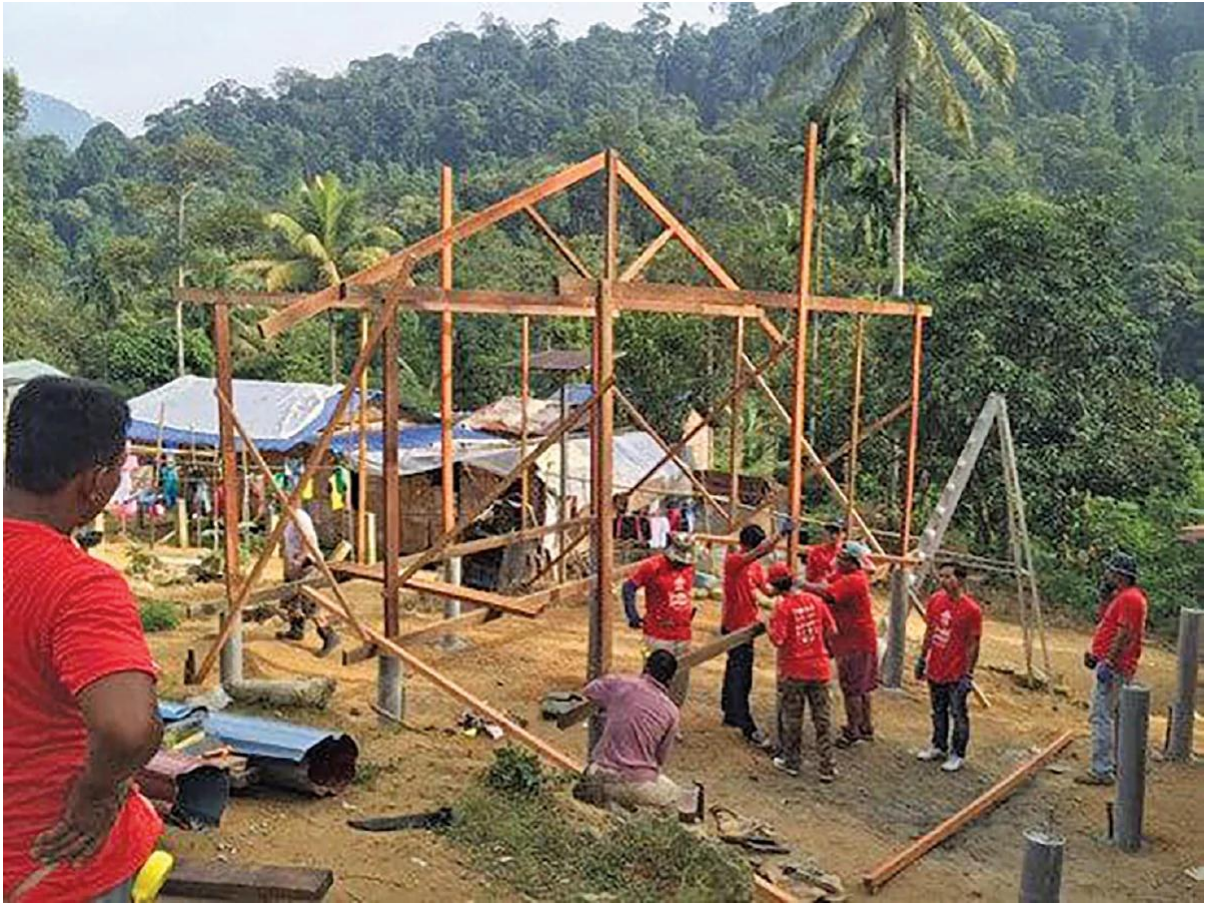
PROJEK membina rumah komuniti asli menggunakan kaedah IBS Kayu.

"Di Jabatan kami sendiri, Pasukan Penyelidikan Senibina Komuniti (Community Architecture Research Team atau CART), bersama dengan pihak Industri, Myteakwood Holdings Sdn Bhd sedang menjalankan usaha menonjolkan penggunaan teknologi IBS kayu ini.