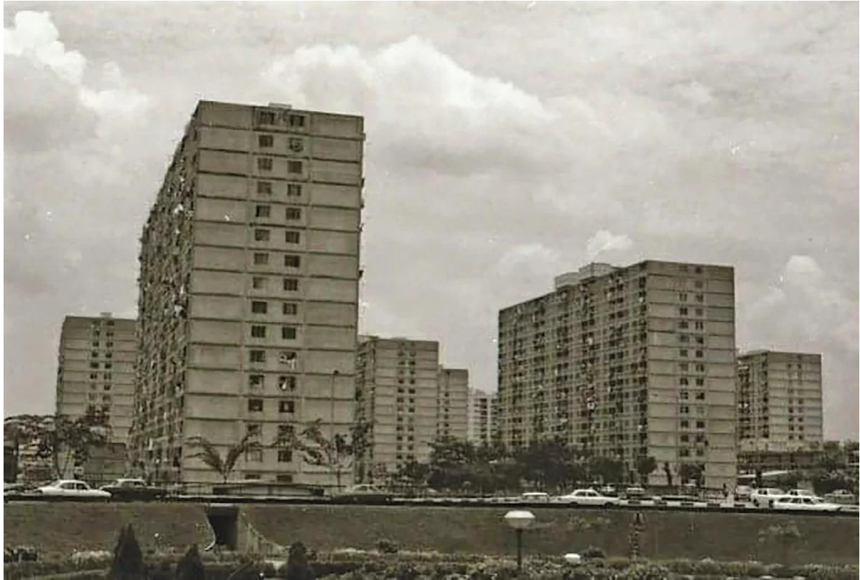
FLAT pekiling antara bangunan menggunakan kaedah IBS terawal pada tahun 1964.

Realiti penggunaan IBS kayu pada projek pembinaan bangunan di Malaysia pada pandangan beliau sangat mencabar.