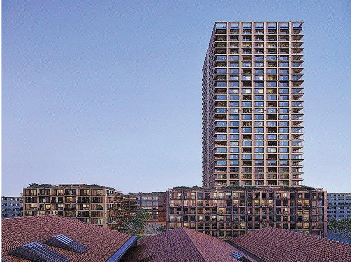
BANGUNAN Rocket dan Tigerli di Swizerland mengetengahkan teknologi IBS kayu.