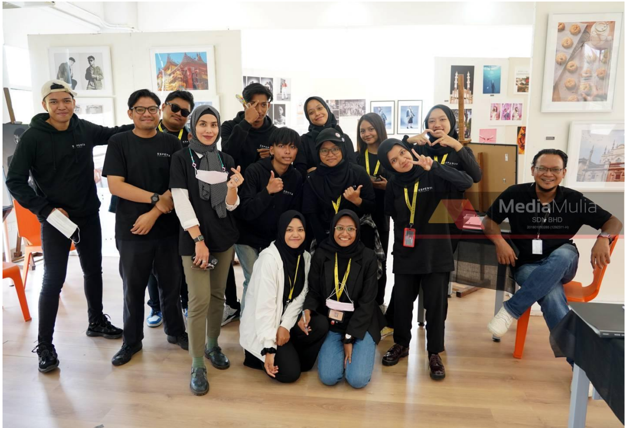
Pelajar Diploma Fotografi UNISEL Batch DP39 bersama tenaga pengajar

Oleh Shahril Azman Mohd Zain 4 Ogos 2022, 10:00 am