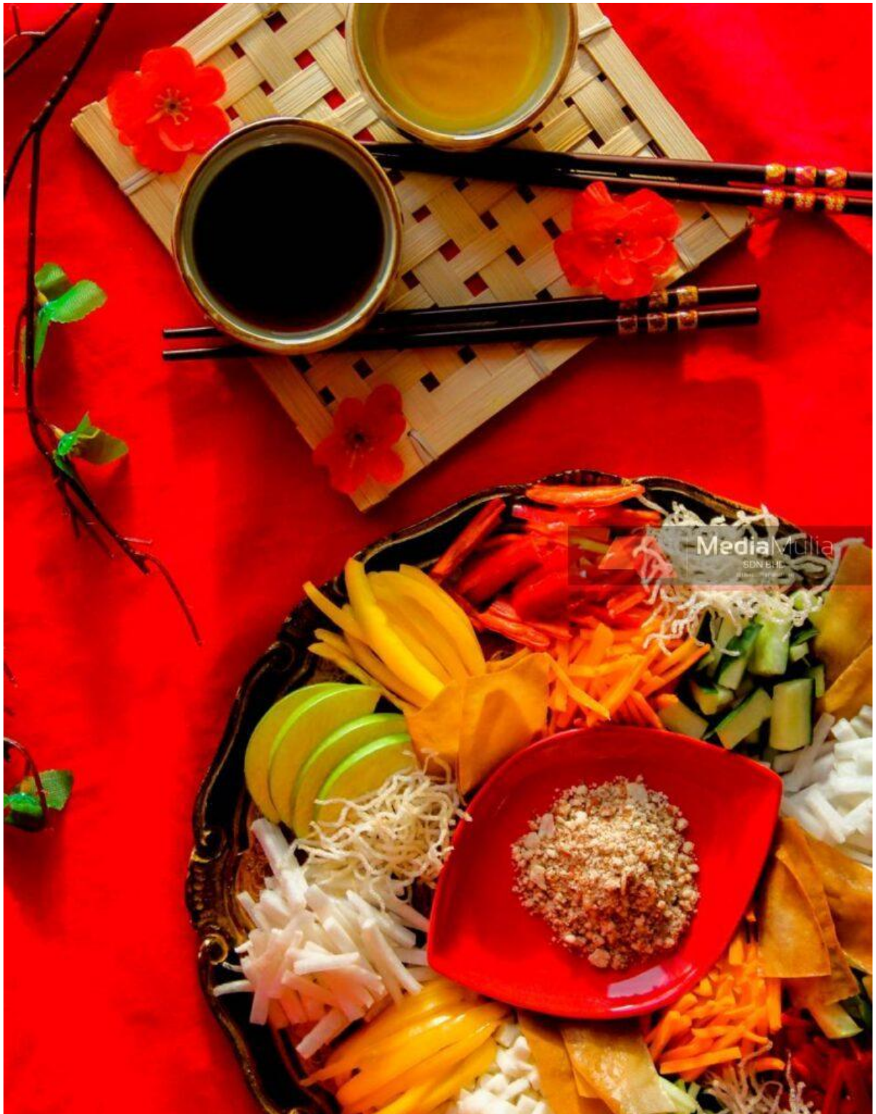
Fotografi komersil makanan oleh Aina Zulhaira.

Pelajar didedahkan dengan kemahiran menghasilkan gambar secara analog dan memproses mengikut urutan sehingga menghasilkan gambar hitam putih. Salah seorang pelajarnya, Ahmad Asyraf gembira dan terharu berjaya menamatkan tugas yang diberi. Beliau cenderung menghasilkan gambar