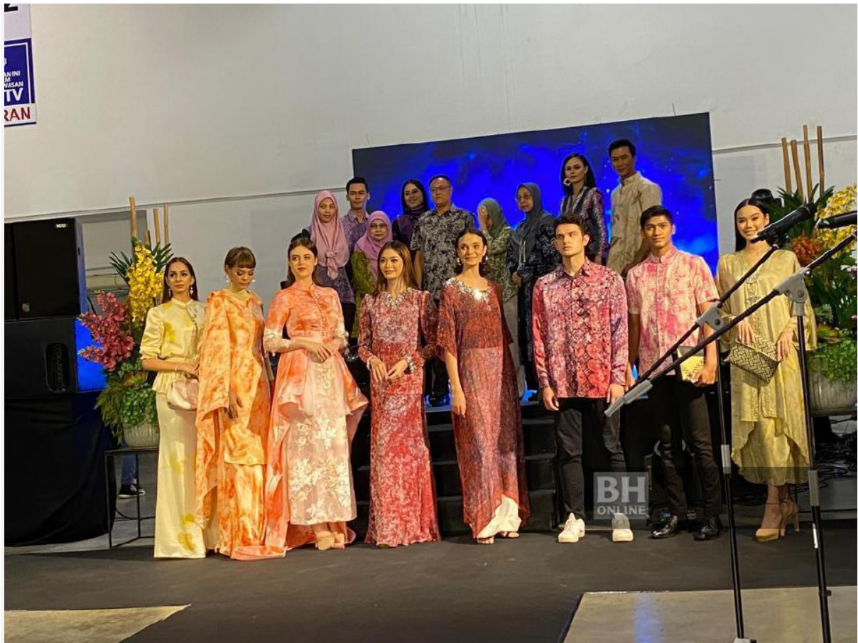
Antara 48 koleksi busana batik gunakan gabungan moden dan klasik.

Oleh Latifah Arifin - Ogos 14, 2022 @ 5:09pm latifah@bh.com.my