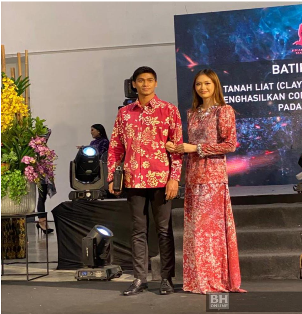
Antara rekaan batik mengadaptasikan konsep Agrotourism dengan penghasilannya gunakan tumbuh-tumbuhan dan tanah.

Turut menarik perhatian adalah kombinasi warna yang diketengahkan dengan kebanyakannya mengaplikasikan warna lembut sekali gus memperlihatkan rekaannya lebih santai, anggun dan sesuai digayakan untuk acara sama ada formal atau tidak rasmi.