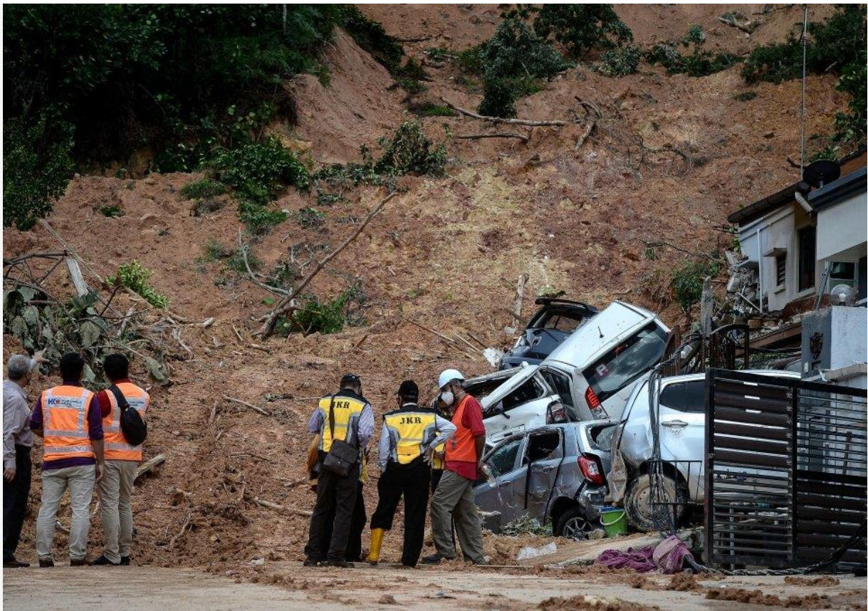
Keadaan kenderaan milik penduduk rosak teruk selepas kejadian tanah runtuh di Taman Bukit Permai 2 Ampang, petang kelmarin.

"Kita mahu meneliti sama ada keadaan berkenaan berlaku di Taman Bukit Permai 2 atau di kawasan lain di Ampang, selain pihak jawatankuasa tidak menerima sebarang pernyataan rasmi berhubung perkara ini daripada beliau," katanya.