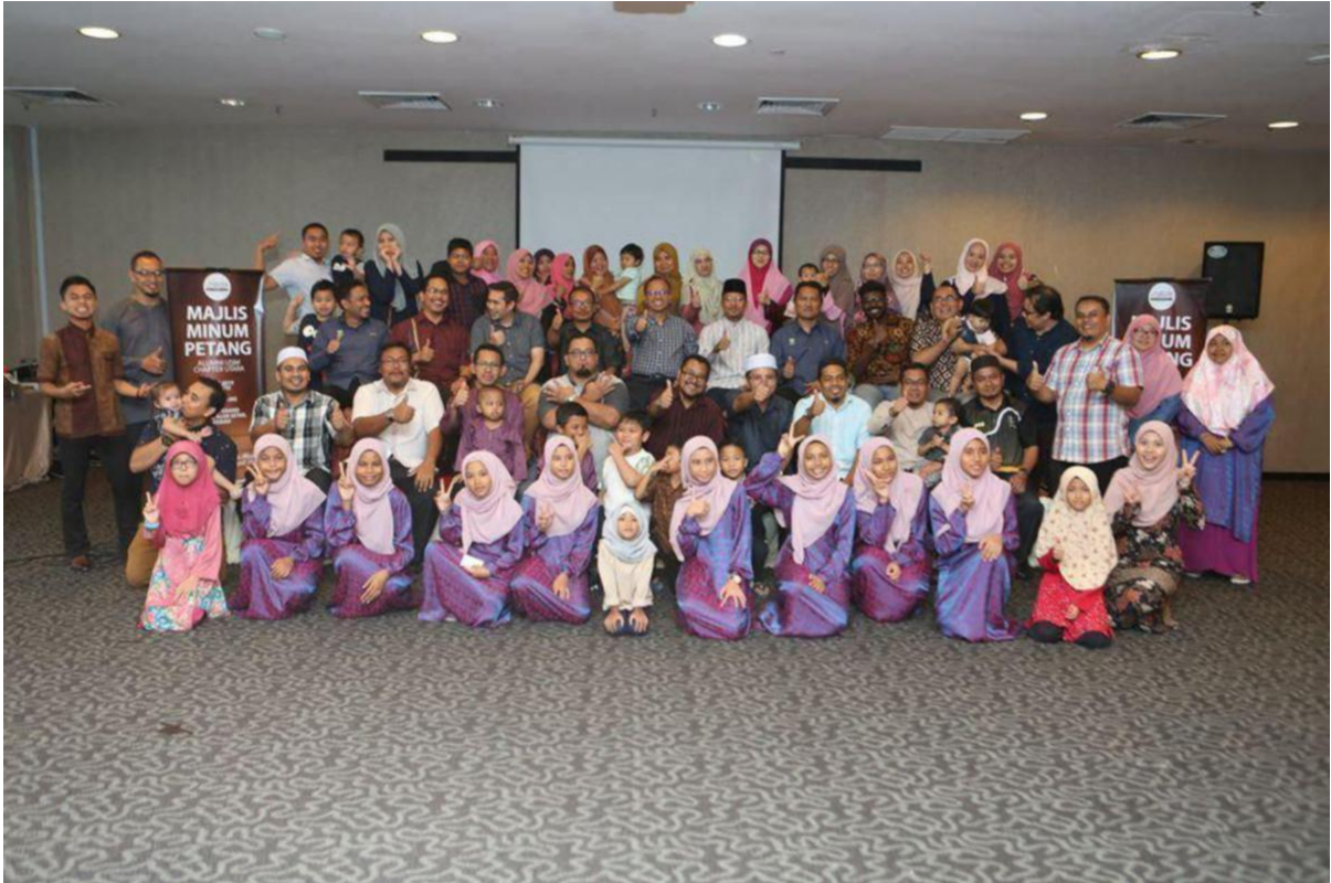
MINUM petang Chapter Alumni Pantai Timur.

"Jaringan kerjasama dua hala ini perlu diperkukuhkan melalui komunikasi yang berkesan tanpa meniadakan keharmonian antara pihak pentadbiran dan bekas pelajar.