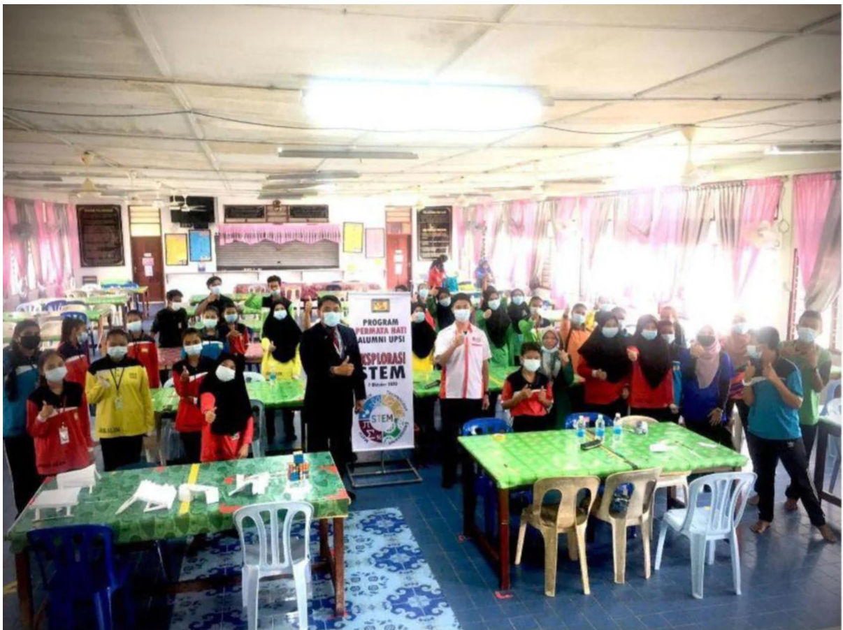
PROGRAM pemindahan maklumat oleh Alumni UPSI - Eksplorasi STEM di SMK Slim Oktober 2020.

"Sebagai contoh, Pusat Alumni dan Kerjaya USIM menyediakan pelbagai platform untuk alumni kembali bersama-sama universiti antaranya melalui penganjuran program Mentor Usahawan, Inspirational Talk, Wacana Alumni, Penajaan Anugerah Konvokesyen dan Penajaan Tabung Kebolehpasaran Graduan USIM-UI Platinum (syarikat alumni)," katanya.